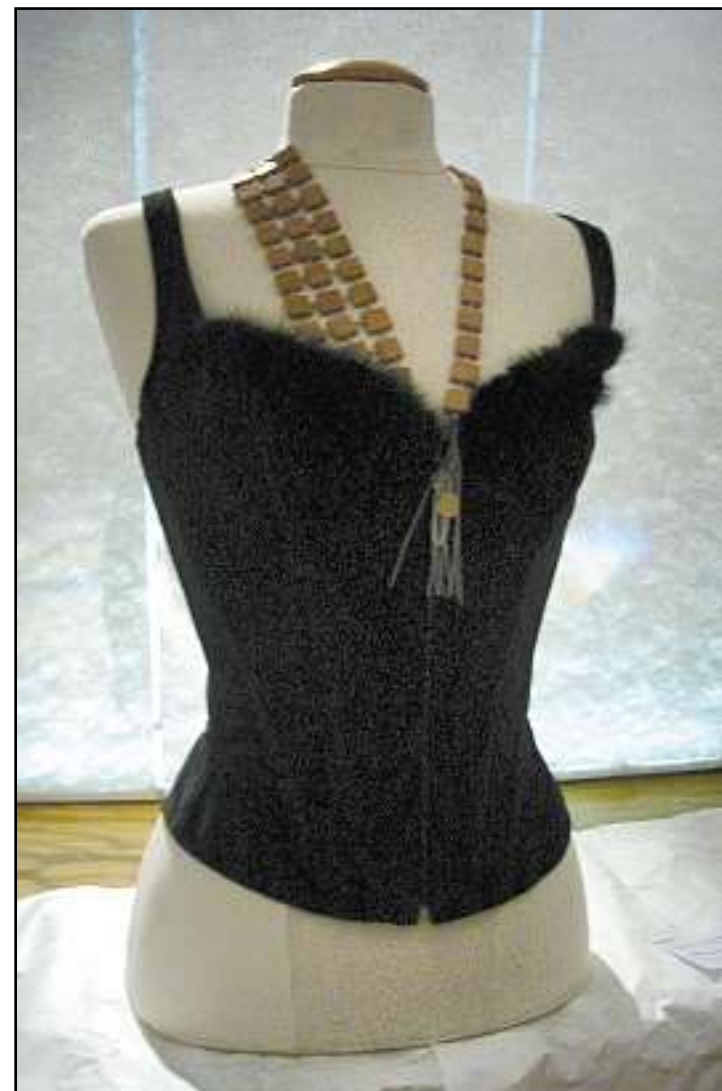
Le corset orthopédique embelli, l'une des pièces de l'exposition.

Le cocon blanc abrite entre autres des bustiers, une orthèse et des tableaux représentant le corps dans des états différents.